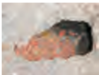
转运站周边地面硬化处理，有鼠洞的地方投放鼠药灭鼠，再进行堵洞