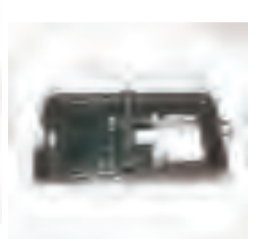
室内可选用粘鼠板、鼠笼、鼠夹等器械进行灭鼠，沿墙放置