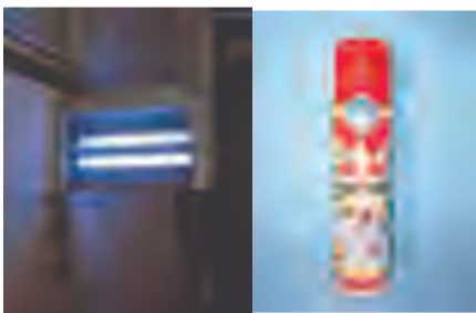
室内安装灭蝇灯（不得靠墙，距离墙面20厘米以上）灭蝇，保持常亮状态，少量成蝇也可选用菊酯类杀虫剂灭蝇