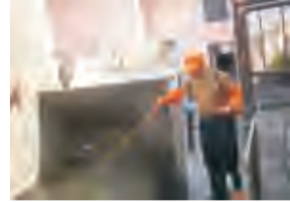
室内及周边有苍蝇孳生的地点可定期使用菊酯类杀虫剂进行灭蝇