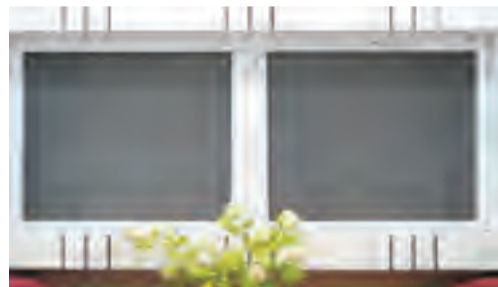
与外界相通的排气孔或窗户可安装纱窗防止蚊、蝇进入