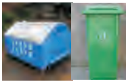
转运站周边使用带盖垃圾容器，及时清理垃圾，孳生蝇蛆的场所喷洒甲基嘧啶磷等杀虫剂杀灭