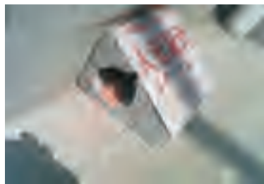
转运站内外分别设置2-3个毒饵站灭鼠