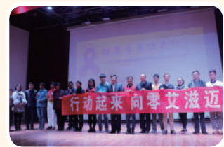
2015年11月29日，健康牵系你我他——2015年十城百校遏制艾滋接力活动走进江汉大学。