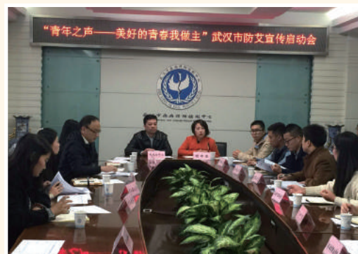
2015年11月10日，武汉市防艾宣传校园行工作部署会在市疾控中心召开。