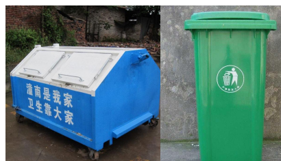
使用带盖垃圾容器，及时清理垃圾，孳生蝇蛆的场所喷洒甲基嘧啶磷等杀虫剂杀灭