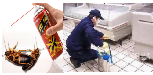
售肉台和水池底下等孳生蟑螂较多的缝隙处喷洒灭蟑气雾剂，或由专业人员喷洒菊酯类杀虫剂进行灭蟑