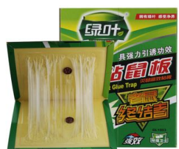
室内可选用粘鼠板、鼠笼、鼠夹、电猫等器械进行灭鼠，器械沿墙放置