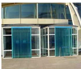
入口处安装塑料门帘防蝇，塑料门帘底部离地面不大于2厘米