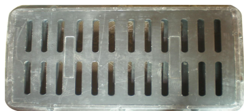
下水道有老鼠时，可在下水道内挂放蜡块毒饵灭鼠