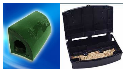
市场内外20-30米沿墙设置一个灭鼠毒饵站