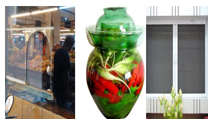
安装纱门纱窗，隔间售卖口安装玻璃梭门防蝇，直接入口的食品随时盖好盖子