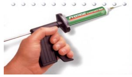
喷洒杀虫剂后1周，可使用灭蟑毒饵或胶饵灭蟑，注意“点多、量少”，蟑螂密集处可适当增加点数