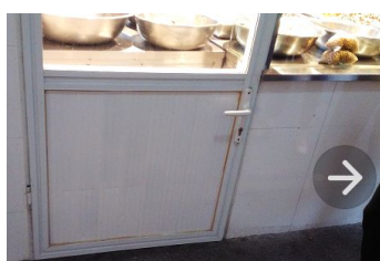
售卖干货、卤菜等的隔间门窗严密，缝隙小于6毫米，防止老鼠进入