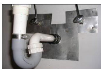
墙上的孔洞用硬物封闭（或堵塞）