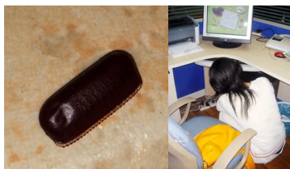
查找并清除蟑螂卵鞘，同时做好室内卫生，堵塞缝隙减少蟑螂孳生