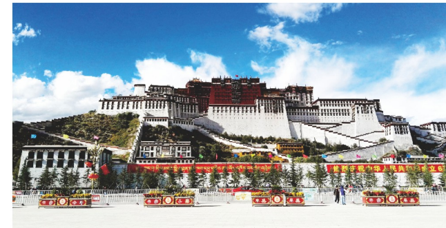
← 白宫红殿湛蓝天 盖世高原气万千 —武汉市疾控中心 王燕君