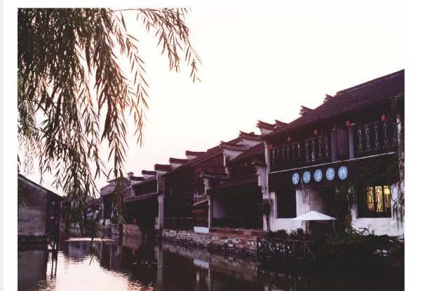
→ 日出江花红胜火 春来江水绿如蓝 武汉市疾控中心 曾晶-